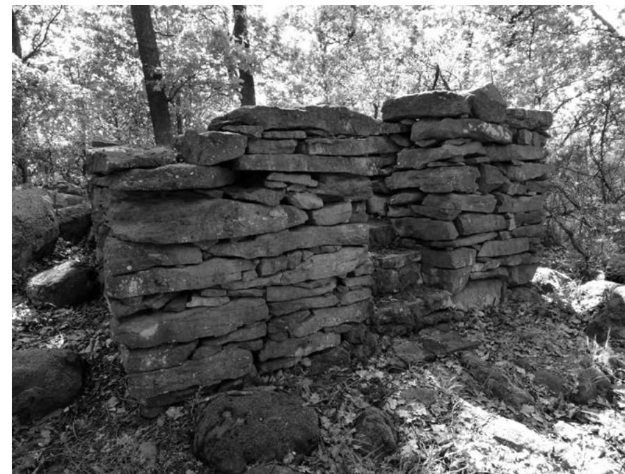
Kramársky vrch – celkový pohľad na hlásku

Protiturecká strážna veža nad Krupinou je najznámejšou vartovkou Slovenska. Je jednou z desiatok strážnych pozícií z čias výpadov Osmanskej ríše na územie horného Uhorska. Okrem samostatne stojacich veží (vartoviek) mali strážnu funkciu tiež ďalšie objekty. Išlo o kostolné a mestské veže, strážne miesta (stráže) a odlesnené kopce s výhľadom do krajiny (varty).