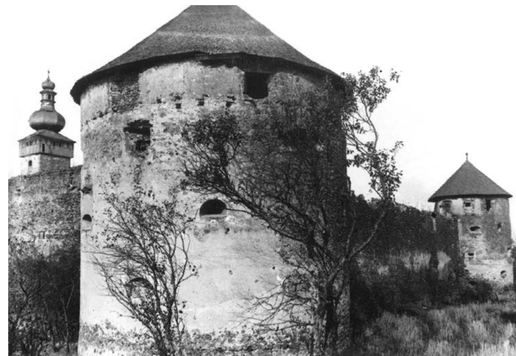
Bašta so severnou vežou kláštorného kostola, ktorá sa zrútila po druhej svetovej vojne, na historickej fotografii z roku 1932. Foto: Archív Pamiatkového úradu SR, Zbierka negatívov, sign. 20639.

Osudy Konventu sv. Štefana kráľa v Bzovíku počas vlády Arpádovcov sme predstavili v jednom z predchádzajúcich čísiel (2021/2). Nemenej zaujímavé sú aj udalosti spojené so životom premonštrátov v Bzovíku v nasledujúcich storočiach až do roku 1530.